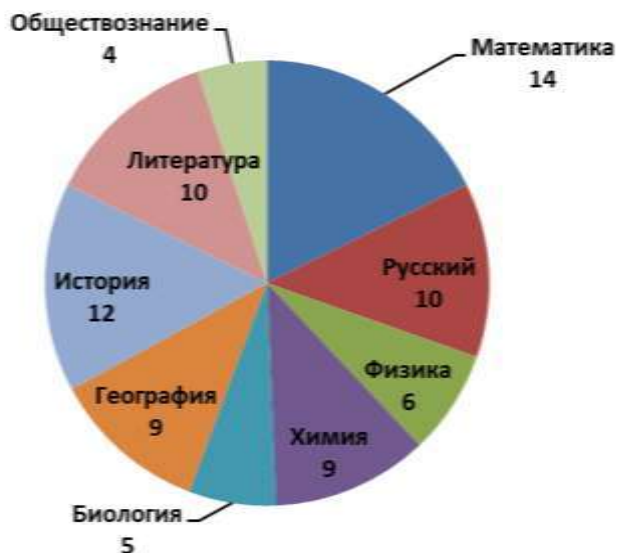
Рисунок 2 – Распределение учителей-предметников по предметам, успешно прошедших процедуру оценки предметных и методических компетенций в курсе «Школа современного учителя»

Всего в процедуре оценки предметных и методических компетенций участвовали 111 учителей-предметников Ростовской области. 79 педагогов успешно прошли процедуру оценки, что составляет 73% от общего числа участников процедуры оценки от региона.