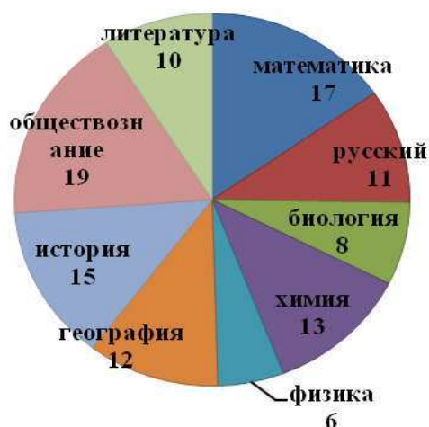
Рисунок 1 – Распределение учителей-предметников, участвующих в процедуре оценке предметных и методических компетенций в курсе «Школа современного учителя»

Распределение по предметам педагогов, участвующих в процедуре оценки, можно увидеть на Рисунке 1.