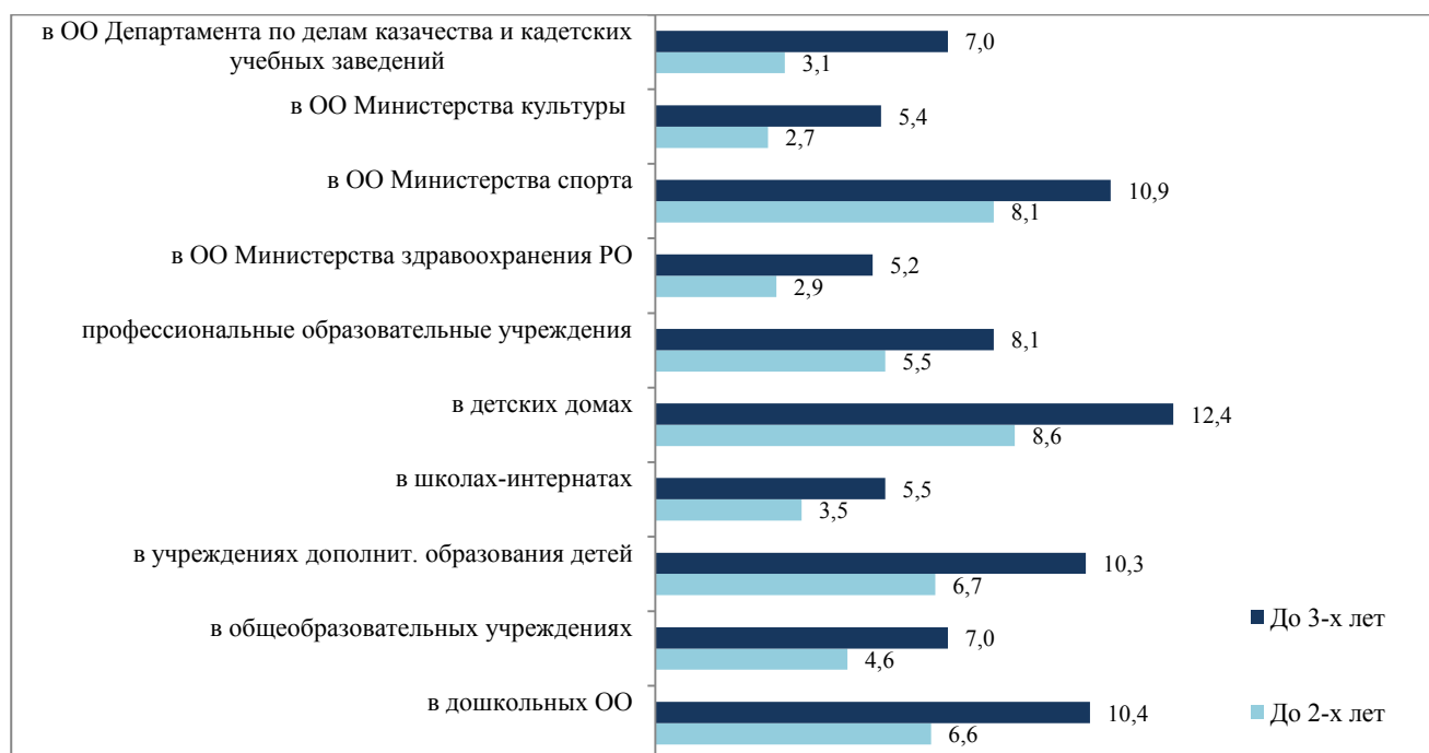
Диаграмма 2. Распределение педагогических работников в разрезе типов образовательных организаций

В разрезе различных типов образовательных организаций наибольший удельный вес сотрудников со стажем работы до 2-х лет фиксируется в детских домах Ростовской области (8,6%), образовательных организациях, подведомственных министерству физической культуры и спорта Ростовской области (8,1%). Категория педагогических работников со стажем до 3-х лет преобладает также в детских домах области (12,4%), образовательных организациях, подведомственных министерству физической культуры и спорта Ростовской области (10,9%), в дошкольных образовательных организациях (10,4%) и учреждениях дополнительного образования детей Ростовской области (10,3%). (Диаграмма 2)