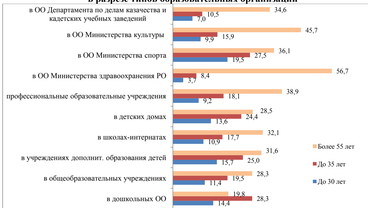
Диаграмма 1. Возрастной состав педагогических работников в разрезе типов образовательных организаций

Сравнительный анализ возрастного состава педагогических работников в разрезе типов образовательных организаций показывает, что удельный вес молодых работников до 30 лет не превышает четвертой доли от общего числа сотрудников. Наибольшие показатели в этом отношении фиксируются в образовательных организациях, подведомственных министерству физической культуры и спорта Ростовской области – 19,5 % и в учреждениях дополнительного образования детей – 15,7%, а наименьшие – в образовательных организациях, подведомственных министерству здравоохранения Ростовской области – 3,7% и образовательных организациях, подведомственных Департаменту по делам казачества и кадетских учебных заведений – 7%. (Диаграмма 1)