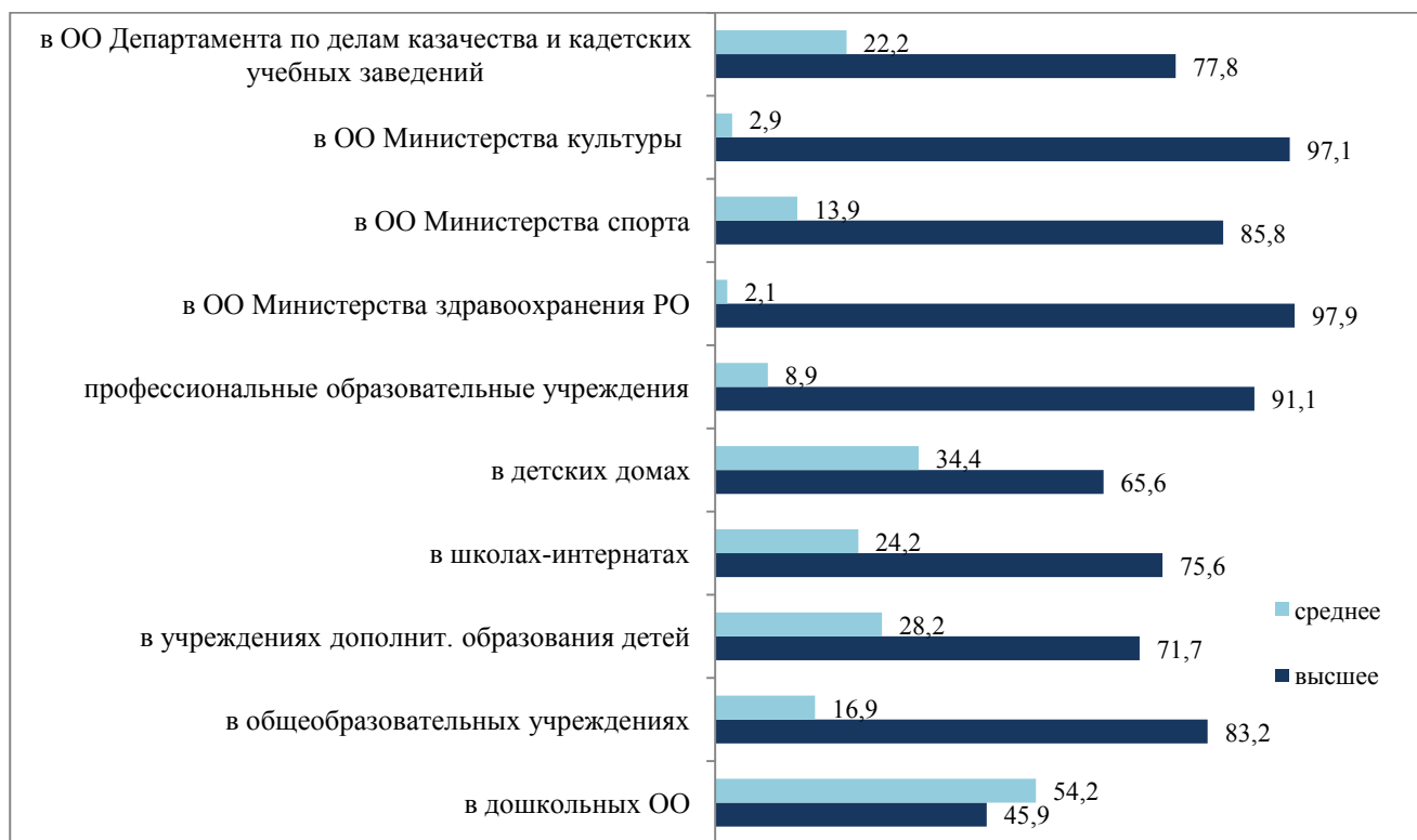
Диаграмма 3. Уровень образования педагогических работников различных типов образовательных организаций Ростовской области

Общий процент обеспеченности образовательных организаций Ростовской области педагогическими работниками на 01.07.2015 составляет 94,8%